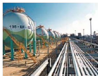
バイオエタノール工場(ブラジル)

廃棄物(はいきぶつ)では、 下水の汚泥(おでい) 、 食品廃棄物 、 産業廃棄物 などからガスをつくり出し、燃料として供給(きょうきゅう)する バイオガス 事業や、木造住宅の解体(かいたい)やり