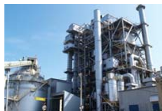
バイオマス発電所(日本)