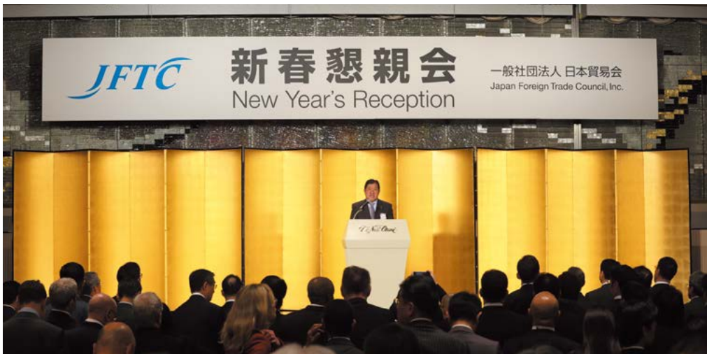
安永会長による開宴挨拶の様子