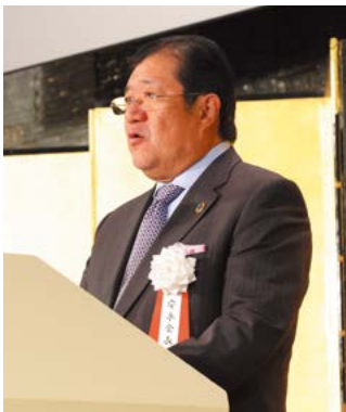
開宴挨拶 安永会長