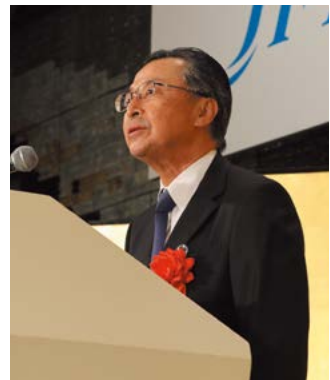
乾杯発声 石黒日本貿易振興機構理事長