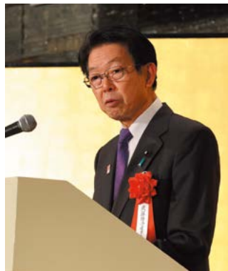
主賓挨拶 武藤経済産業大臣