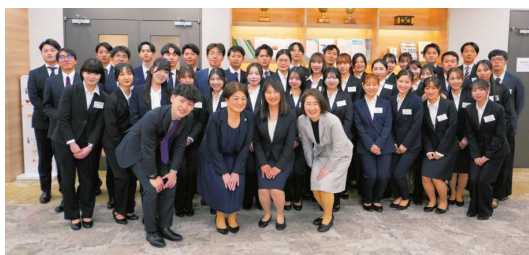
2025年度商社新人研修

新人商社パーソンを対象とするオリジナルの研修では、一般的なビジネスマナー講座のほか、先輩商社パーソンによる講義、交流会を行っています