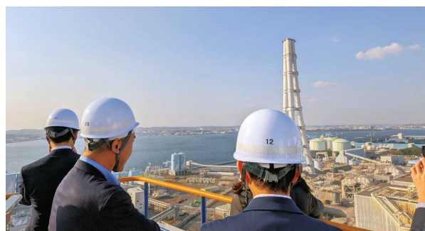
委員会活動・見学会

会員企業の活動に有益な情報を提供するため、さまざまな会員限定のセミナーや説明会を開催しています。2025年度は、米国の新政権発足や通商政策の変動、関税を巡る議論の再燃を受けたセミナーや説明会を多数開催しました。商社業界のダイバーシティ推進を後押しするセミナーなど、好評な企画を継続して開催しています。