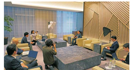
新聞社による会長への取材