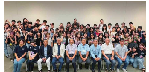
「高校生国際交流の集い2025」

活動会員は約2,700名に上り、政府機関や地方自治体、中小企業、小中高高等教育機関、留学生支援機関などに対する人的支援を行っています。2025年度はコロナ前の活動レベルに向けて実績を積み重ね、さらに基盤を盤石のものとする1年と位置づけてさまざまな活動を行いました。