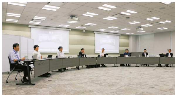
日本貿易会ゼミナール特別企画

有識者を招き、幅広いテーマを取り上げる講演会「日本貿易会ゼミナール」を通年開催しています。2025年度はグローバルサウスの政治経済を中心に計20回開催し、通算500回目を迎えました。ハイブリッド形式での開催や「講演会動画アーカイブ」の活用 の定着により、延べ1,000人を超える会員が参加しています。