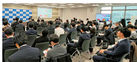
マイナビ学生の窓口と連携したPRイベント