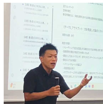
フォローアップイベント

2024年度に実施した商社に特化した『「ビジネスと人権」専門人材育成プログラム』の参加者に対するフォローアップを実施するとともに、会員企業の人権デューデリジェンスの取り組みをさらに支援するため、2024年度に引き続きILO駐日事務所から講師を招き、計3回にわたり「ビジネスと人権タスクフォース」を開催しました。