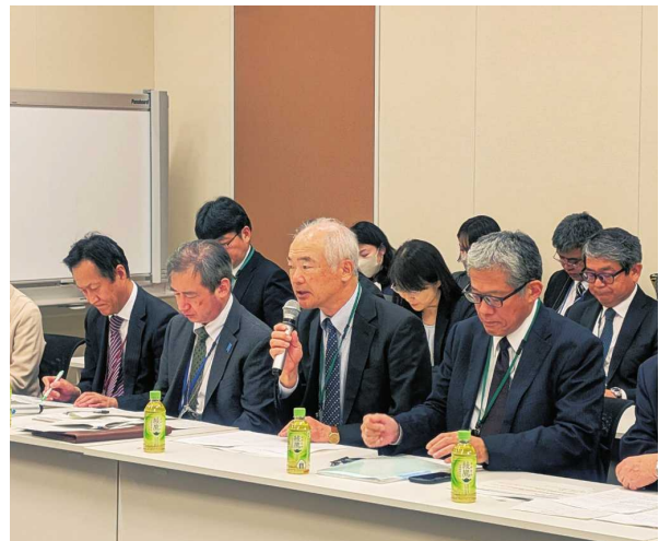
在外教育推進議員連盟総会