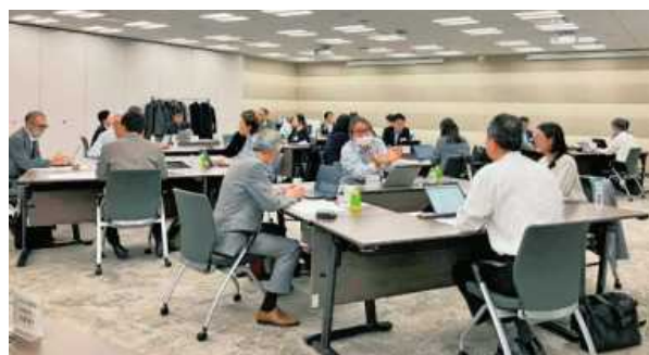
委員会活動・グループディスカッション

また、常設委員会の委員長等が一堂に会する委員長連絡会を開催し、委員会を越えた連携を目指して意見交換を行っています。