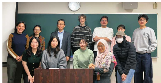
京都大学大学院経済学研究科での講義

商社の歴史、業態の変化、機能や役割、国内外での事業例について、大学院等で講義を行っています。2025年度は京都大学大学院、同志社大学、名城大学、福岡大学で実施しました。