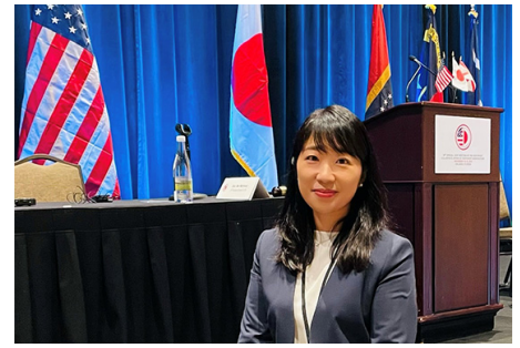
2022年11月 日米南東部会 @フロリダ・オーランドにて